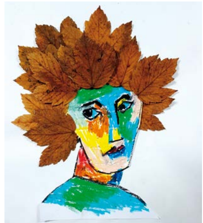
Dessiné à partir du tableau de Matisse « La femme au chapeau ».