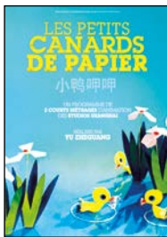
Trois courts-métrages d'animation en papier plié qui raviront les tout-petits.