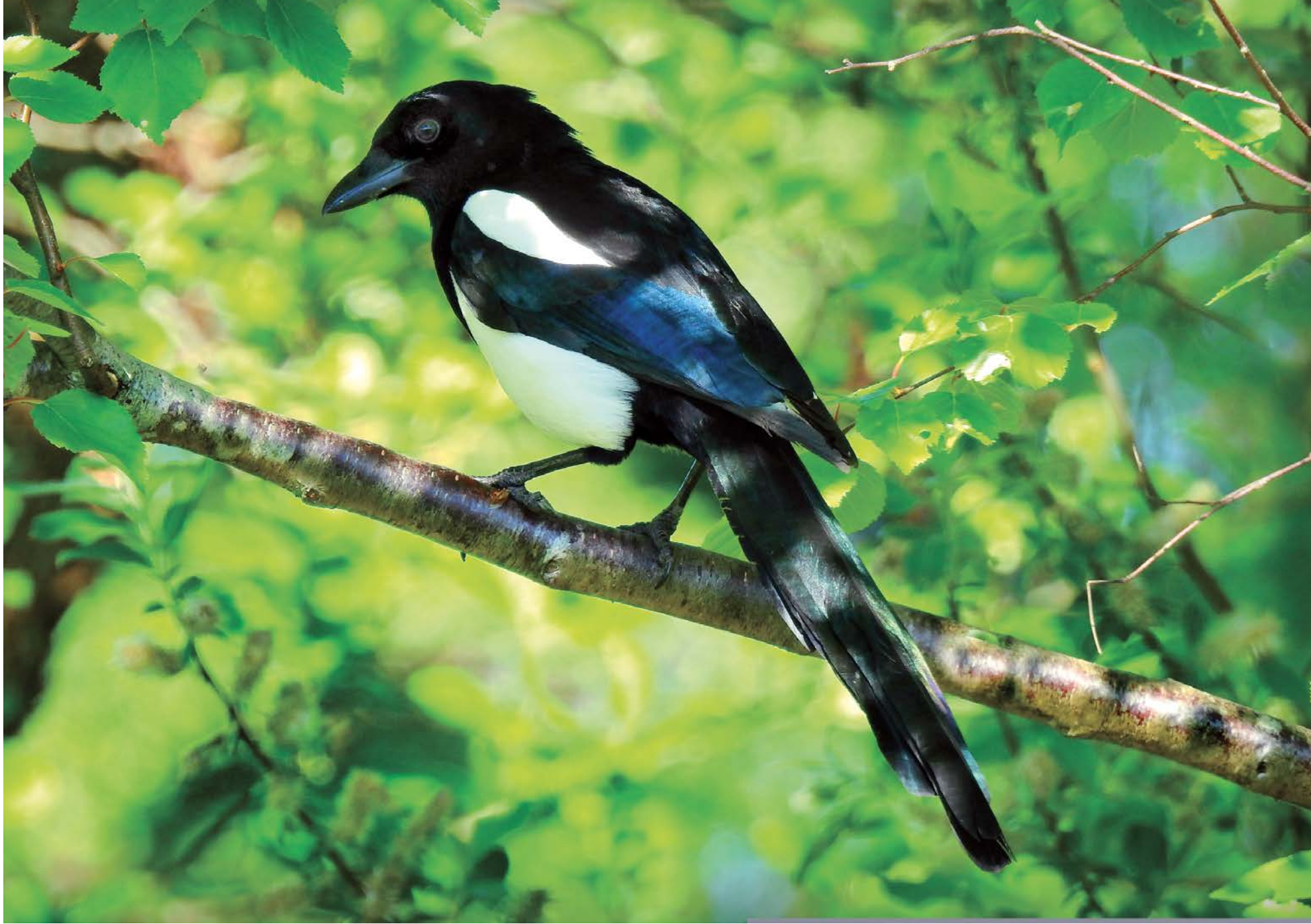
La pie