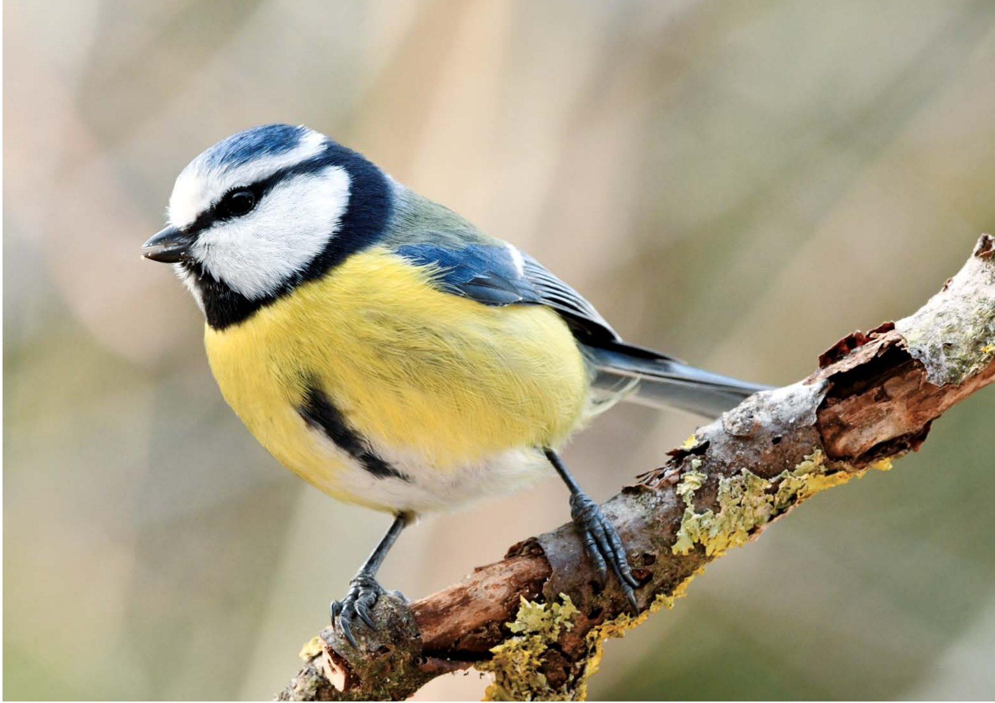
La mésange bleue