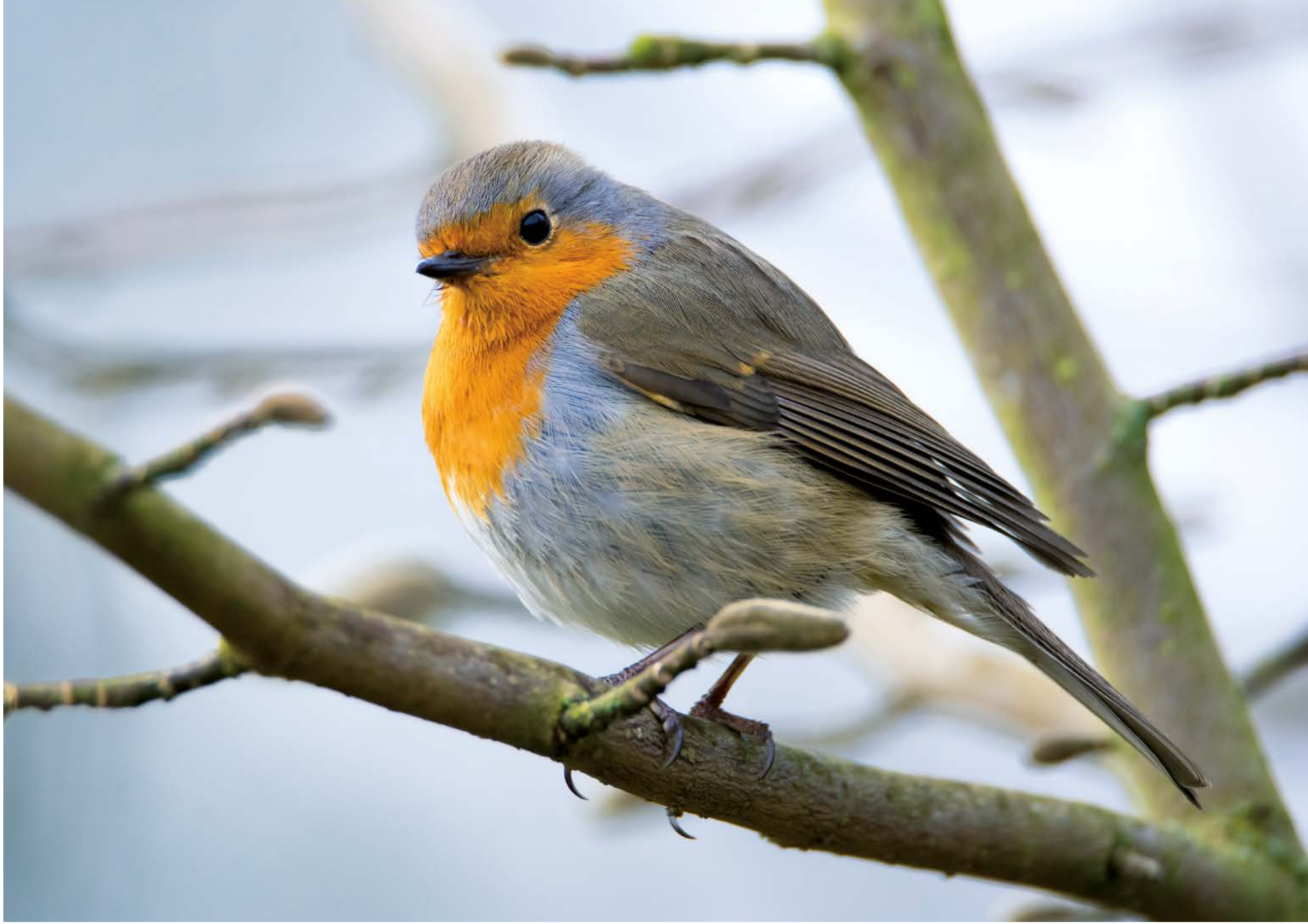
Le rouge-gorge